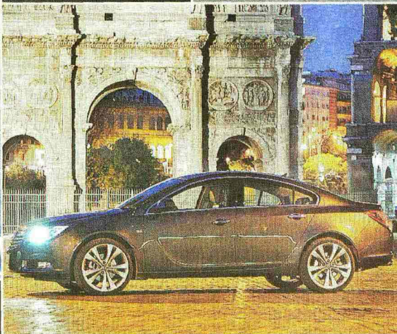
Nelle foto, in senso orario, i sedili in pelle; la modanatura a «lama» del pannello porta; il passaggio al Celio e poi, di notte, davanti all'Arco di Costantino. Infine il dettaglio di un cerchio e la leva del cambio automatico