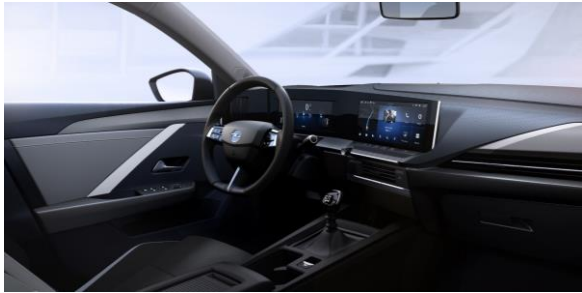
EDITION – X4FX