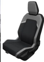
GS – X6FX