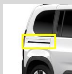
Figura 5 - Profili guida delle porte laterali scorrevoli lunghi in tinta carrozzeria (DY36)