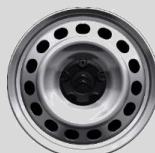
Figura 3 - Cerchi in lamiera 16" (DZQR)