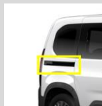
Figura 4 - Profili guida delle porte laterali scorrevoli corti con finitura nera" (DY00)